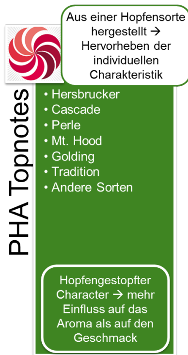
Abbildung 1: PHA® Topnotes

Die PHA® Topnotes Produkte werden mittels spezifischer Extraktions- und Destillationsmethoden aus Hopfendolden hergestellt. Dabei liegt das originäre Hopfenöl in einer Propylenglykol-Lösung vor. Propylenglykol ist ein anerkannter Zusatzstoff gemäß der EU Richtlinie 2006/52/EC. Die PHA® Produkte werden weltweit ausschließlich von der Barth-Haas Gruppe vertrieben.