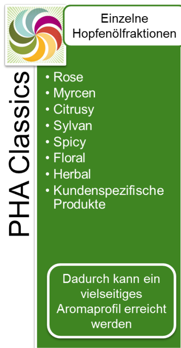
Abbildung 1: PHA® Classics

Die PHA® Classics Produkte werden mittels spezifischer Extraktions- und Destillationsmethoden aus Hopfendolden hergestellt. Dabei liegt das originäre Hopfenöl in einer Propylenglykol-Lösung vor. Propylenglykol ist ein anerkannter Zusatzstoff gemäß der EU Richtlinie 2006/52/EC. Die PHA® Produkte werden weltweit ausschließlich von der Barth-Haas Gruppe vertrieben.